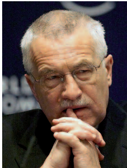
Dr. h. c. prof. Ing. Václav KLAUS, CSc. 07. 10. 2004