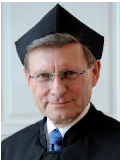
prof. Dr. hab. Leszek BALCEROWICZ 08. 12. 1999