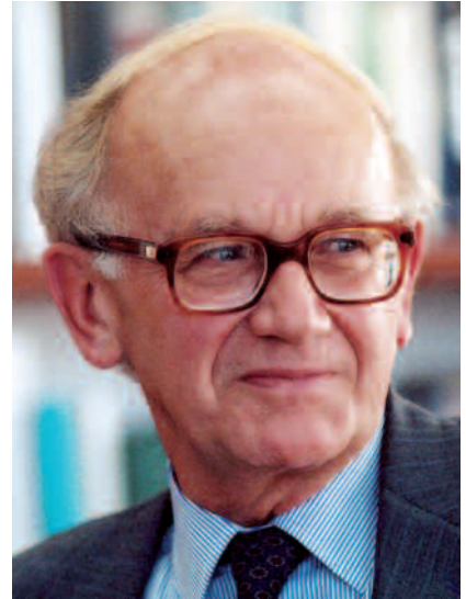
prof. emeritus Alexandre LAMFALUSSY 18. 01. 2007