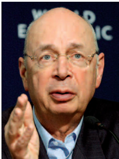
prof. Klaus SCHWAB 04. 11. 1996