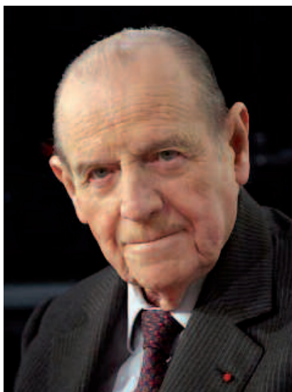
Dr. h. c. prof. Raymond BARRE 18. 05. 2000