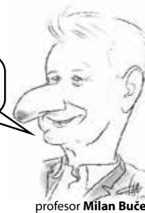
profesor Milan Buček

Už je to 25 rokov, čo som založil túto katedru.