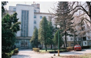
Horský park: Prokopa Veľkého 41