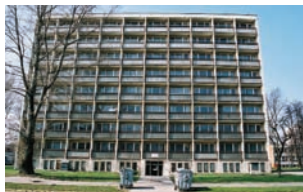
Starohájska 4, Starohájska 8

– nástupná zastávka je Námestie hraničiarov, autobus č. 88, priamy spoj a výstupná zastávka je Ekonomická univerzita. Nástupná zastávka je Starohájska, autobus č. 68, priamy spoj a výstupná zastávka je Ekonomická univerzita.