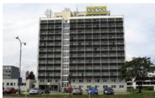
Ekonóm, Prístavná 8

– nástupná zastávka je Námestie hraničiarov, autobus č. 88, priamy spoj a výstupná zastávka je Ekonomická univerzita. Nástupná zastávka je Starohájska, autobus č. 68, priamy spoj a výstupná zastávka je Ekonomická univerzita.