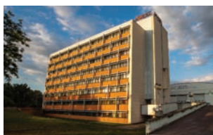
Student Residence, Viedenská cesta 7

– nástupná zastávka je Prístav, autobus č. 87, priamy spoj a výstupná zastávka je Ekonomická univerzita.