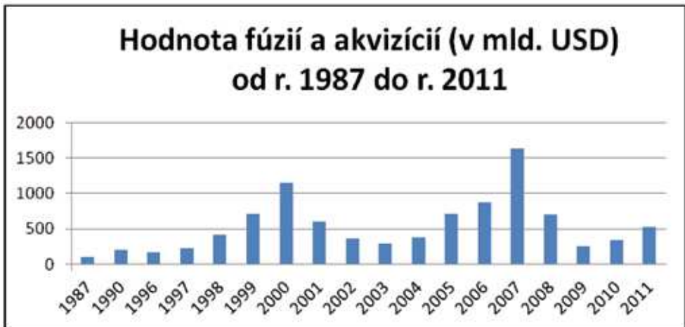
Hodnota M&amp;A (v mld. USD) od r. 1987 do r. 2011